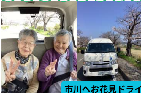
市川へお花見ドライブ!!